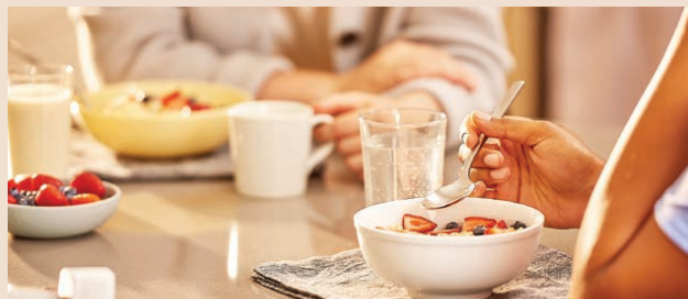
養成良好的飲食習慣