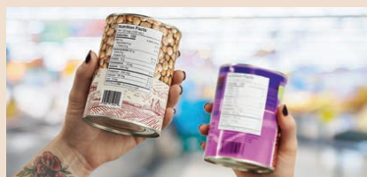
學會利用食物標籤中的資訊