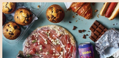
限制高鈉、高糖、高飽和脂肪的食物